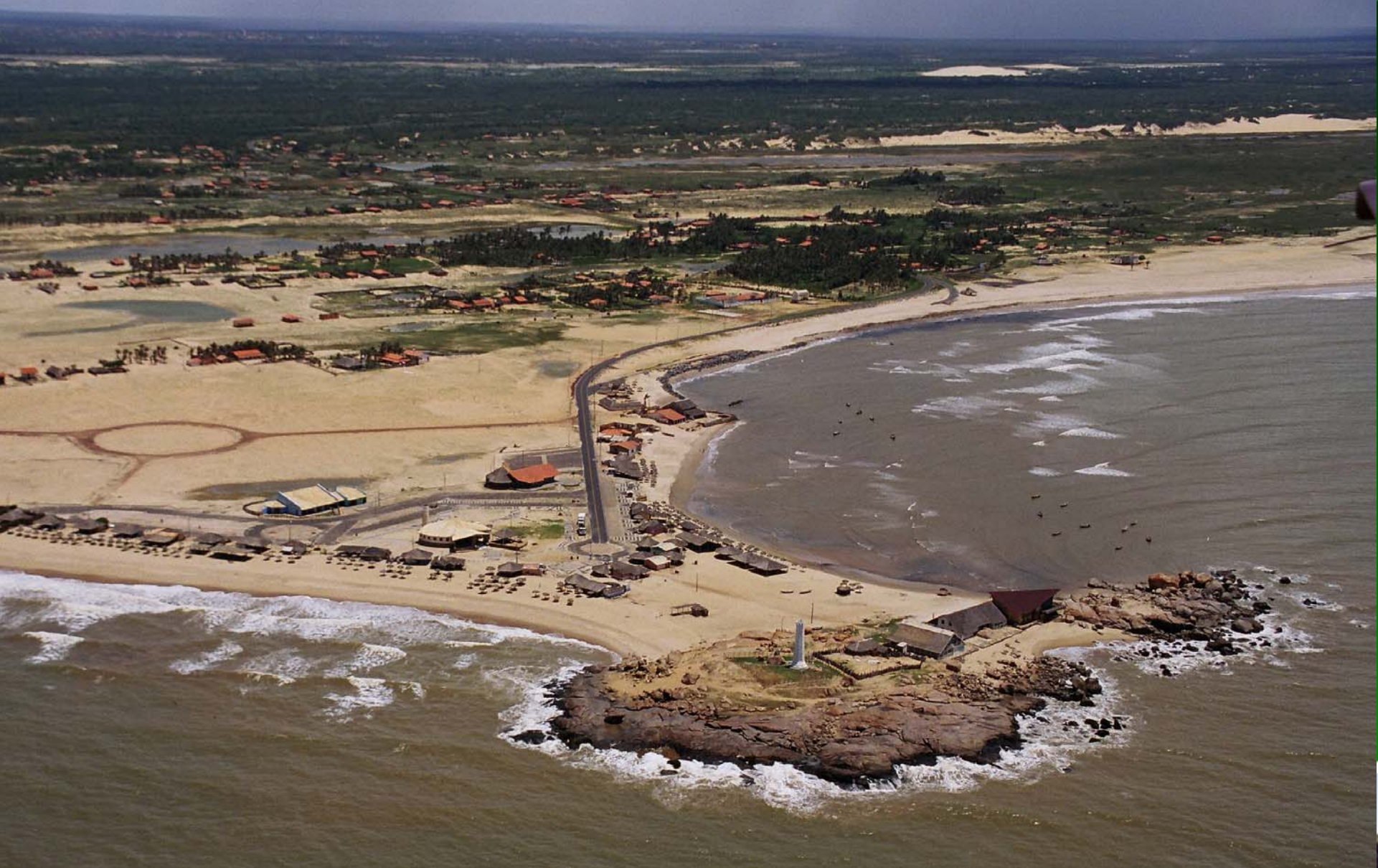
PEDRA DO SAL – Ilha Grande